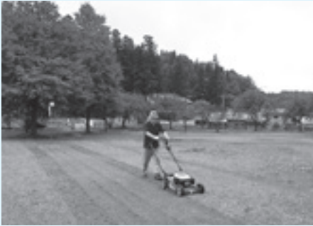
パークゴルフ大会に向けて沢口河川公園の芝刈りもしています

他の老人クラブとの交流も、スポーツの大会や演芸会などへの参加を通じて活発にしています。