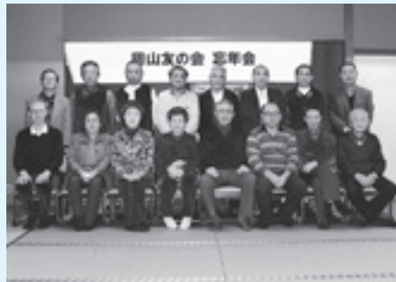
忘年会の旅行先で記念撮影(令和元年12月、鹿角市)

新年会と忘年会では旅行をして、温泉と食事をゆつくり楽しみながら親睦を深める時間を作っています。秋に開かれる演芸会と芸能大会には、出演者だけでなく他の会員も応援で参加するほど仲が良く、信頼関係の強さが自慢のクラブです。