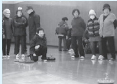
曙大学の高齢者スポーツ講座で屋内カーリング「カローリング」に挑戦

また、田頭コミュニティセンターで開かれる高齢者講座「曙大学」やコミセン祭りの準備と運営の手伝いに参加するなど、他のつながりを大切にしています。