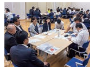
▲市内企業と就職希望の生徒がいる高校の先生との懇談会

まちの事業部とは—— 市の産業界全体を多数の事業部を有する一つの大きな事業体に見立て、企業の人事機能を集約。採用や育成に係るコストの削減や人材の流れを地域内で完結させるなどのメリットがあります。