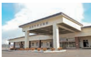
▲国保西根病院が移転し、8月1日から開院する八幡平市立病院