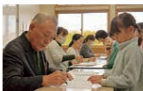
▲放課後に丸付けをする教育パートナー(安代小たけのこ教室)