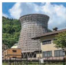
▲電気や温泉を供給し、市の観光を支える地熱

サステイナブルツーリズムとは—— 持続可能な観光を求める考え方や行動という意味で、地域の環境や自然、文化を切り売りするのではなく、それらを守りながら観光を提供します。