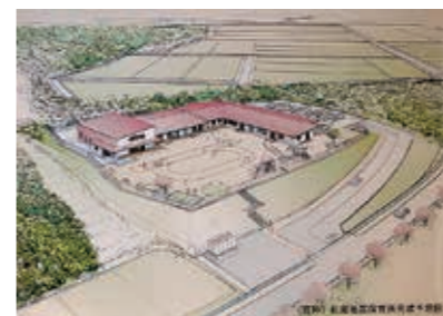
▶ 松野保育所と寄木保育所を統合し、新築している松尾地区保育所(仮称)の完成予想図