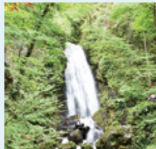
落差15mから水が流れ落ち、豪快に水しぶきを上げる不動の滝

明治時代に地籍調査の一環として作成された桜松神社境内の絵図を常設展示しています。不動の滝に来た際は、ぜひ博物館にも立ち寄ってください。