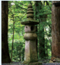
石灯籠・享和2(1802)年奉納 (桜松神社境内)

神仏分離令により、明治4(1871)年に本社に安置されていた不動明王像を別の場所に移し、新たに災厄 さいやくほつじよ 抜除の女神・