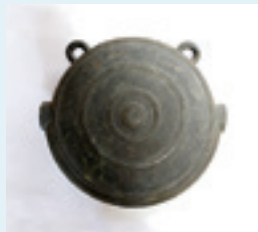
鱧口・明和8(1771)年奉納 (桜松神社蔵)

瀬織津姫 せおりつひめ を祭った後、桜松神社に改称されました。桜松の名称は、境内の松の木に桜の花が咲き、住民を驚かせた言い伝えに由来しています。春は新緑と桜、秋は紅葉など、壮観な景色が広がり、散策スポットとして人気があります。