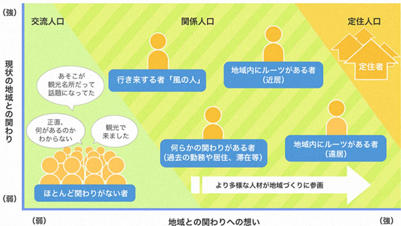
関係人口の概念図