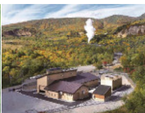
松尾八幡平地熱発電所