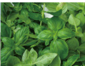
八幡平スマートファーム