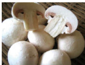
ジオファーム八幡平

参加資格: 市民または地熱活用に興味のある方(18歳以上) 定員: 各コース先着30名(申込先着順、定員に達し次第受付終了)