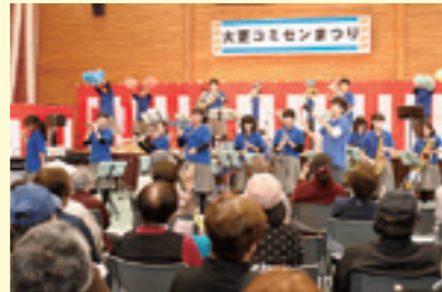
大更コミセンまつり吹奏楽部演奏(西根中)