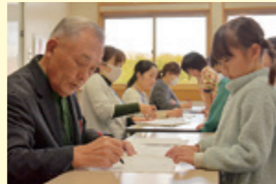
たけのこ教室(安代小)