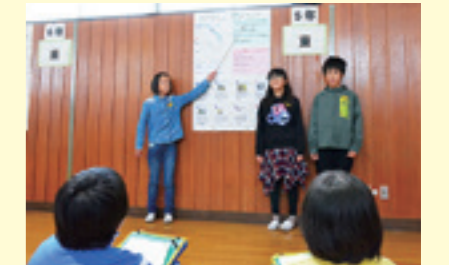
消防団と作成した防災マップを発表(平館小)