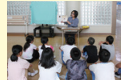
絵本の読み聞かせ(寺田小)