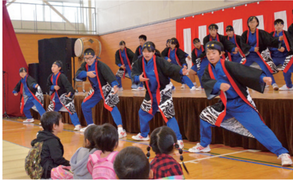
西根第一中の生徒がコミュニティ・スクール関連事業の一環として平館ふれあいまつりに参加し「よさこいソーラン」を披露