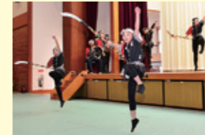
寄木念仏剣舞伝承(寄木小)