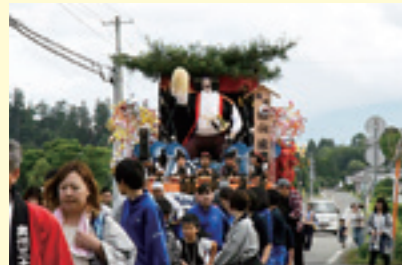
白坂観音例大祭山車運行参加(西根第一中)