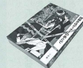
「謎解きはディナーのあとで」 東川篤也著 (小学館刊)