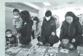
好きな本を選ぶ子どもたち

2月4日、5日、12日の3日間、三歳児図書館ふれあい事業を開催し、親子119人が参加しました。保護者が読み聞かせの講話を聞く間、子どもたちは別室で絵本の読み聞かせや、紙芝居、パネルシアターなどを楽しみました。