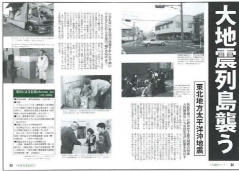
大地震列島襲う 東北地方太平洋沖地震

3月 ▽11日 午後2時46分頃、マグニチュード9.0の地震発生。太平洋沿岸を中心に甚大な被害（4月1日、東日本大震災と命名）。市は、支援物資提供や職員派遣などの支援活動を実施しています。