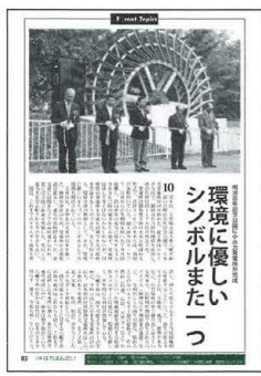
環境に優しい シンボルまた一つ

▽8日 明治百年記念公園に小水力発電所完成。総工費は5670万円で、冬場を除く7カ月稼働。直径3・6メートルの水車からは、約