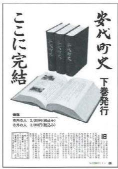
安代町史 下巻発行 ここに完結

4月 ▽1日 西根・松尾地区でコミュニティバス試験運行を開始。西根地区4路線、松尾地区2路線を、1日2〜6便運行しています。