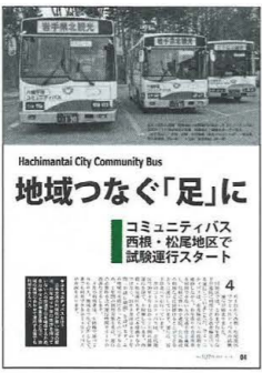
Hachimantai City Community Bus 地域つなぐ「足」に コミュニティバス 西根・松尾地区で試験運行スタート

4月 ▽1日 西根・松尾地区でコミュニティバス試験運行を開始。西根地区4路線、松尾地区2路線を、1日2〜6便運行しています。