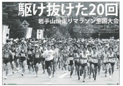
駆け抜けた20回 岩手山焼走りマラソン全国大会

▽24日 第20回岩手山焼走りマラソン全国大会を開催。過去最多の20008人が参加し、健脚を競いました。