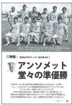
アンソメット 堂々の準優勝