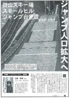
田山スキー場 スモールヒルジャンプ台完成

3月 ▽11日 午後2時46分頃、マグニチュード9.0の地震発生。太平洋沿岸を中心に甚大な被害（4月1日、東日本大震災と命名）。市は、支援物資提供や職員派遣などの支援活動を実施しています。