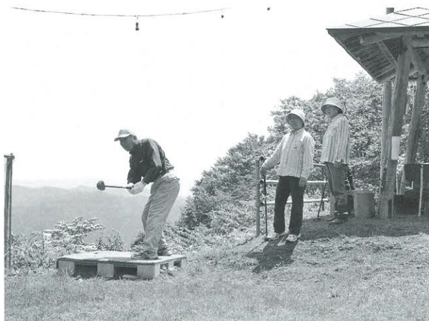
住民自らが整備したパークゴルフ場で早速プレーを楽しみました

6月19日に行われた公園開きでは、地区民約25人が参加して神事を行ったほか、手作りのパークゴルフ場でプレーを楽しみました。角館館長は「地域の人が集まる憩いの場として、これから活用していきたい」と語りました。