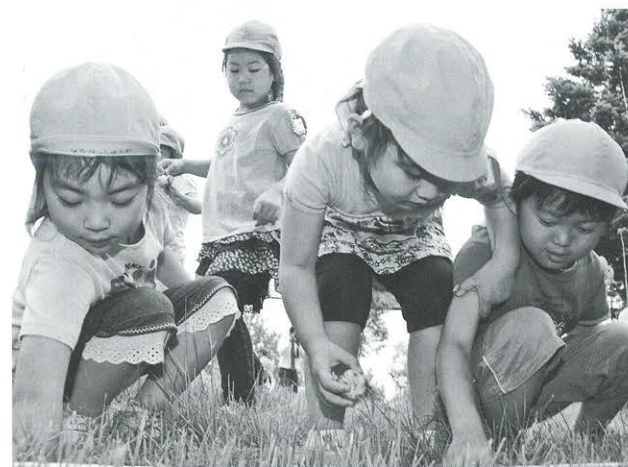
「大きくなあれ」と声を掛けながらユリの球根を植える園児たち