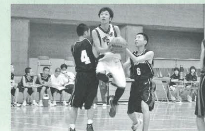
「岩手地区中総体・バスケットボール競技」(6月18・19日、市総合運動公園体育館)