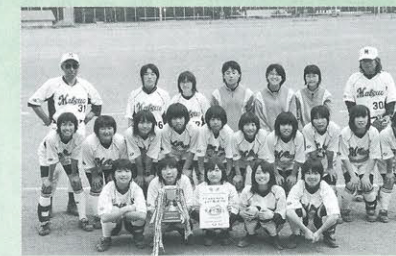
「岩手地区中総体・ソフトボール競技」(6月18・19日、松尾中学校が2年ぶりに優勝)