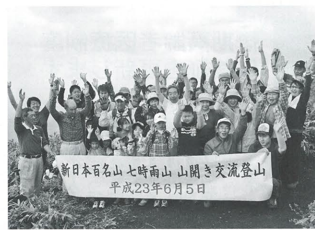
北峰山頂で山開きを祝い、万歳三唱する登山者の皆さん

登山者は、約1時間半かけて山頂に到着。山頂では、山開きを祝って万歳三唱したほか、登山者には登頂手形が贈られました。