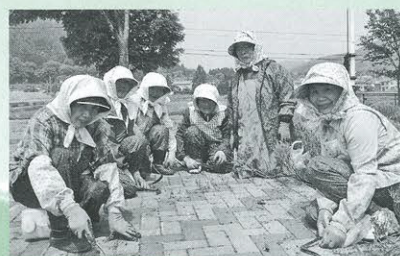
「シルバー人材センター」会員が奉仕作業(6月9日、博物館周辺)