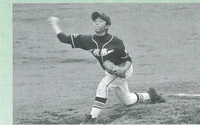
「岩手地区中総体・野球競技」(6月18日、市総合運動公園野球場)