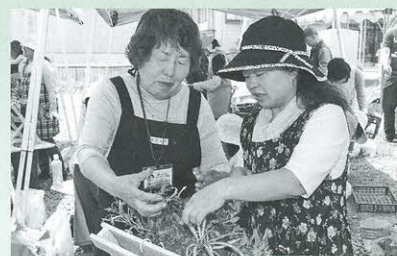
「ミニハンギングバスケット講習会」(6月9日、旧新町幼稚園前)