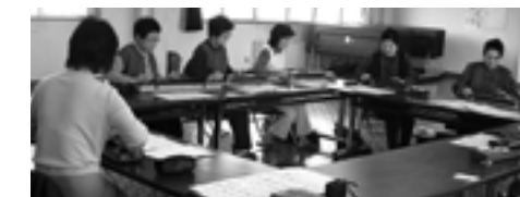
和やかに活動しています