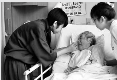
福祉施設での職場体験学習

西根第一中学校は、主に平館小、寺田小の卒業生が入学する学校です。 心身を鍛える生徒【健康】、自ら学ぶ生徒【知性】、心を豊かにする生徒【情操】、自主的に実践する生徒【自主】を目標に掲げています。この目標に