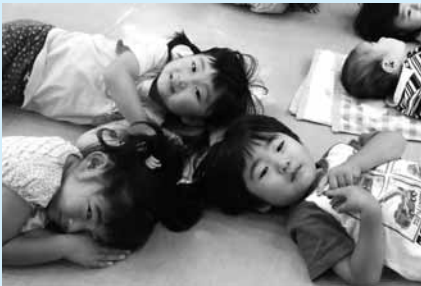
脳と体の健康のため上手な睡眠を