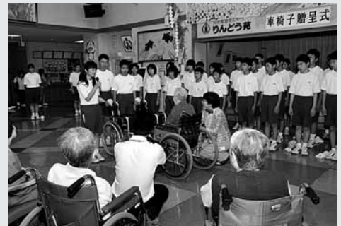
りんどう苑に車椅子2台を寄贈しました

なった奉仕活動を行います。生徒たちは、持参した使い古しの歯ブラシなどを使い、車椅子のすみずみまで清掃。入所者の皆さんに「汚れが気になるところはありますか」など声を掛けながら、施設の車椅子をすべてきれいにしました。