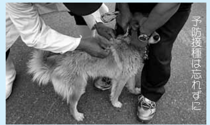
予防接種は忘れずに