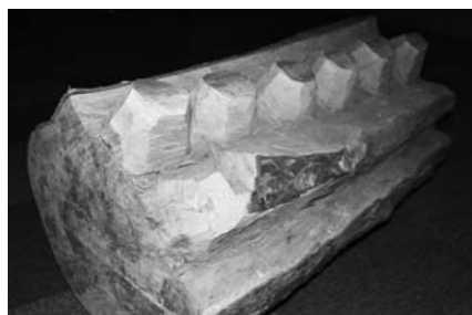
木地ハギトリ(福島県立博物館蔵)

特に木地・街道・芸能・信仰・自然(植生)をキーワードとして、そこにはぐくまれた技や人・自然との交流、芸能や祈りの姿を追いかけてみます。