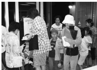
お土産を受け取る参加者たち

市立図書館では、「夏の映画会」を8月7日夜7時半から、図書館の駐車場を会場に開きました。当日は天候にも恵まれ、約30人の親子が集合しました。