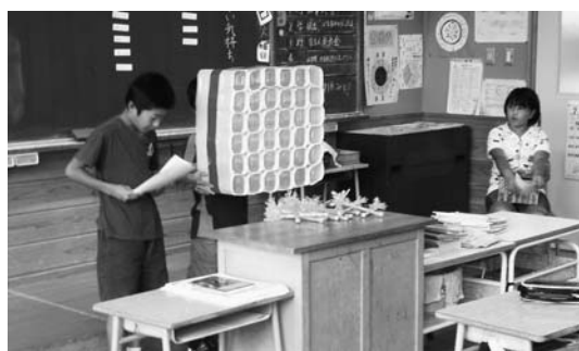
夏休みの取り組みの成果を発表する4年生の児童

発表会は学年ごとに行われ、児童たちは、夏休みに取り組んだ自由研究や、工作などを自慢し合いました。当日は保護者も駆け付け、発表に耳を傾けながら、この夏の児童の成長を感じ取っていました。