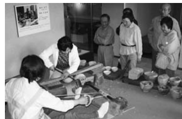
手引ろくろを体験する参加者

博物館開館10周年記念企画展の関連事業としても位置付けています。併せて博物館の各種事業を支えるため、有志がその都