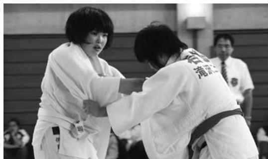
柔道では、西根第一が団体、個人で優勝・入賞などの大活躍