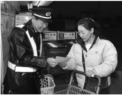
交通安全啓発「湯っくり作戦」 (12月2日、マックスパリュ西根店)