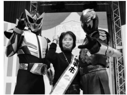
ふるさとCM対象inWATE2008審査会 (11月23日、いわて県民情報交流センター)