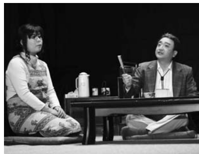
劇団「ふるさと発信株式会社」第11回公演 (11月30日、安代小学校体育館)