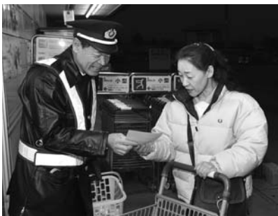
交通安全啓発「湯っくり作戦」 (12月2日、マックスパリュウ西根店)