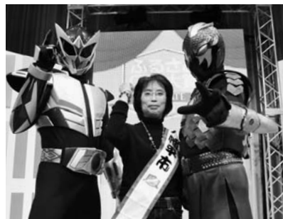
ふるさとCM対象inWATE2008審査会 (11月23日、いわて県民情報交流センター)