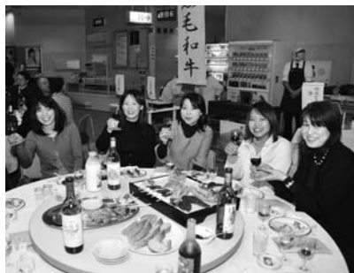
八幡平山ぶどうワインパーティー (12月5日、テトラック安代)

詳しくは、J A新しいわて西部肥育部会(八幡平市田頭39-72-2、☎75-1111)またはEメール(jn_syokit@jasi.or.jp)まで。