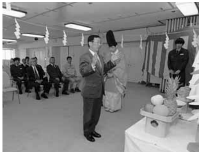
地熱発電調査掘削工事安全祈願祭 (5月7日、八幡平ロッヂ)