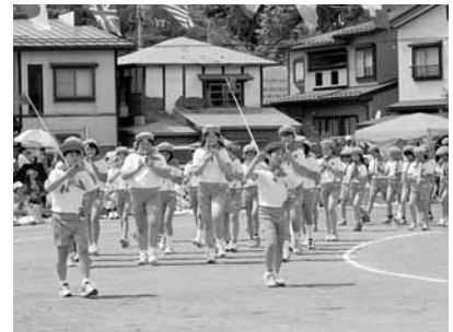
寺田小学校運動会・鼓笛パレード (5月26日、寺田小学校)