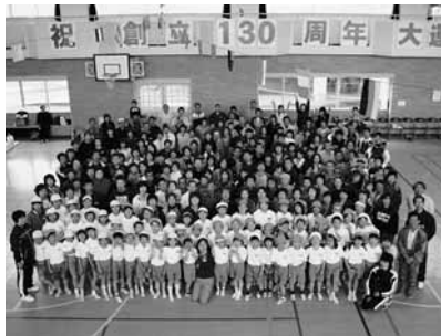
東大更小学校創立130周年記念大運動会 (5月27日、東大更小学校)