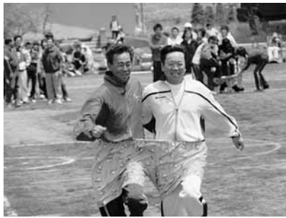
田山小学校運動会・デカパン競走 (5月26日、田山小学校)