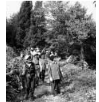
昨年度の鹿角街道散策会(10月)

市外からも参加者が多く、毎年好評なこの企画は、本年度も春から秋にかけて2、3回実施します。老若男女問わず、親子で気軽に参加してください。