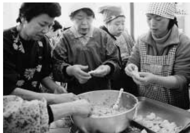
指導を受けながらギョーザ作りに挑戦する参加者

畑公民館では3月7日、手づくり中華料理教室を開催しました。地区に在住する中国出身の方を講師に招き、18人の参加者が指導を受けながらギョーザや肉まん、スープ作りに挑戦。ギョーザ作りでは、皮作りと具を詰めるのに苦労しながら、参加者は完成させた料理に舌鼓を打ちました。