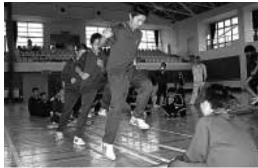
子どもから高齢者まで参加できる種目はいろいろです(昨年の西根地区の同大会より)

第1回市スポーツレクリエーション大会を次のとおり開催します。自分の体力に合った種目を選んで参加ください。また、ボランティア競技役員を募集します。