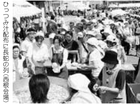
ひつまみ汁配布に長蛇の列(西根会場)