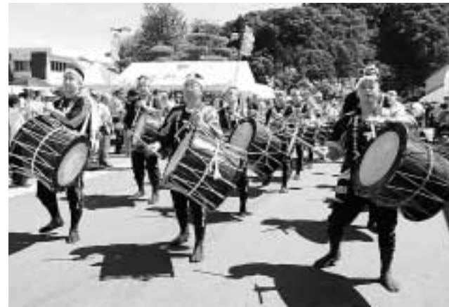
華やかな盆踊りパレード(安代会場)