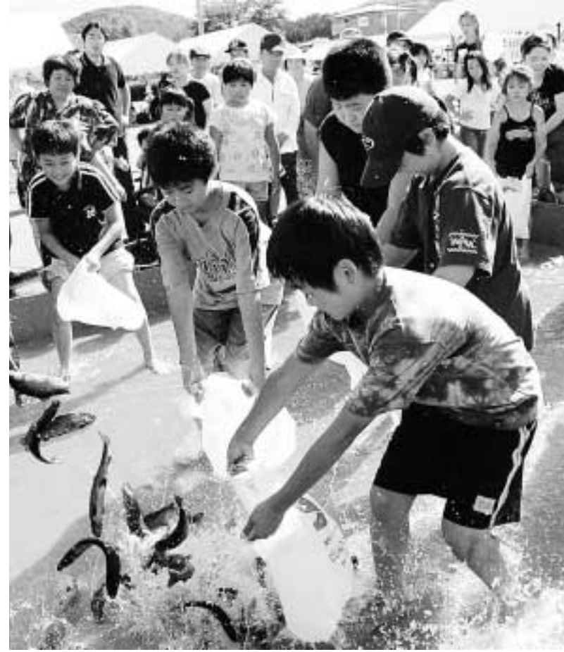
歓声を上げながら、夢中でニジマスを追いかける子どもたち(西根会場)

八幡平市をまるごと堪能 歌も、踊りも、おいしさも!! 八幡平市誕生後初となる第1回八幡平市産業まつりとJA新いわて組合員・ふれあいまつりが9月2、3の両日、西根地区体育館前広場と安代総合支所前広場の2会場で開催。特産品の紹介や多数のお楽しみイベントなどが人気を集め、たくさんの方が訪れました。 西根会場では、大更小、西根中、松尾中の吹奏楽演奏などのステージ発表が披露。八幡平市にまつわるさまざまな難問奇問に答える八幡平市×ゲーム、ゴシの強さが自慢の転作そば打ち実演、脂が乗った豚の骨抜き解体実演、恒例のジャンボひつまみ汁無料配布、ニジマスのつかみ取りなど、盛りだくさんのイベントが来場者を楽しませました。 安代会場では、芸能歌謡ショーをはじめ、安代小マーチングバンド、小屋畑田植え踊り、盆踊りパレードが祭りに花を添え、特産の八幡平ワインやジュースなどが紹介されました。牛肉消費拡大コーナーでは牛の丸焼きが大人気。このほか、みそつけたんぼや赤飯などの手作り料理が好評を博しました。