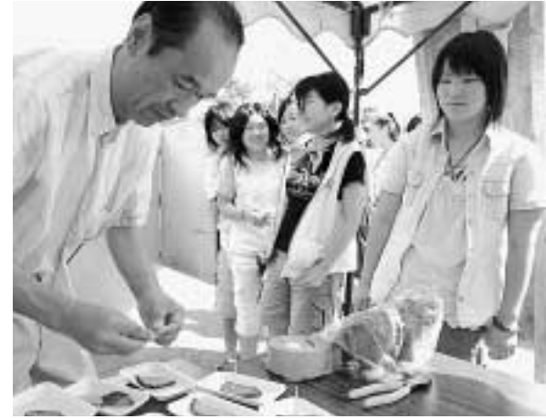
牛の丸焼きに舌鼓(安代会場)