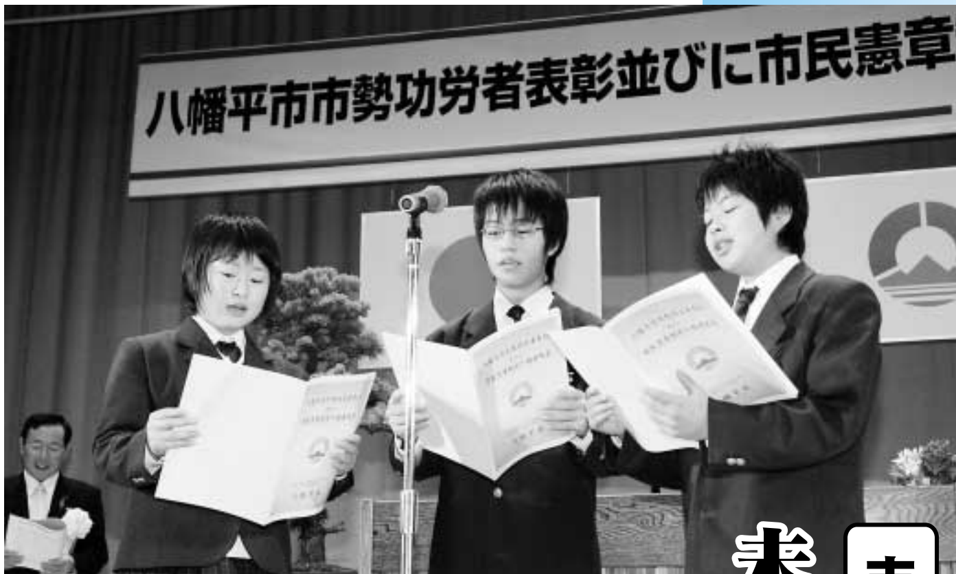
未来への誓いと希望を込めて、市民憲章の唱和を先導する松尾中学校の生徒たち

11月3日に安代小学校で市勢功労者表彰並びに市民憲章制定・推進大会を開催しました。市勢功労者への表彰、まちづくりの指針となる市民憲章と市のシンボルとなる花・鳥・木を発表。また、宮古市と姉妹都市協定を締結しました。