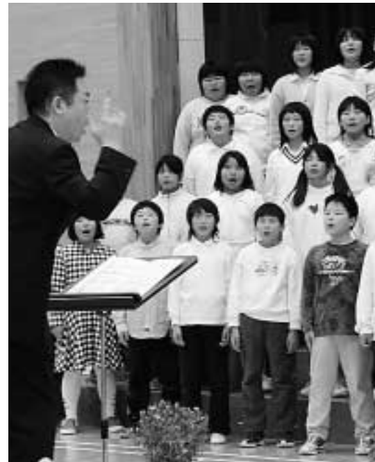
指揮者の先生に注目し、心を一つにしてうたう安代小学校5・6年生

安代地区小中学校音楽祭は11月2日、安代小学校体育館で開催されました。音楽祭には、安代地区の小・中学校4校が参加。参加した児童や生徒は声出しを兼ねて「歌よありがとう」を全体合唱した後、各校の発表が行われ、日ごろの練習の成果を披露しました。 ■安代小学校 5・6年生76人による2部合唱「おくりもの」「夢をあきらめないで」 ■田山小学校 3・4年生21人によるリコーダーアンサンブル「ふるさと」、2部合唱「ぜんぶ空」