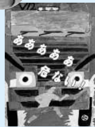
「あああああ 危ない！」