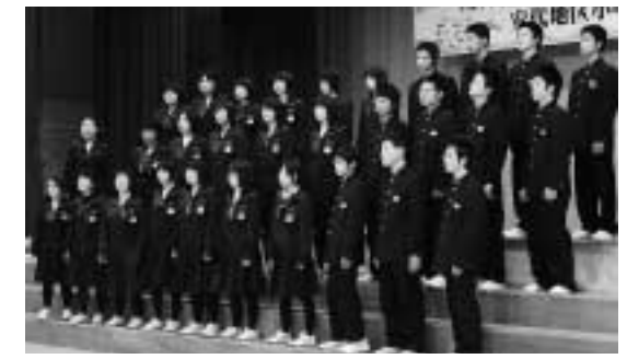
安代中学校3年生の発表は、2曲ともアカペラによる合唱。音程を崩さず、ハーモニーを響かせました

安代地区小中学校音楽祭は11月2日、安代小学校体育館で開催されました。音楽祭には、安代地区の小・中学校4校が参加。参加した児童や生徒は声出しを兼ねて「歌よありがとう」を全体合唱した後、各校の発表が行われ、日ごろの練習の成果を披露しました。 ■安代小学校 5・6年生76人による2部合唱「おくりもの」「夢をあきらめないで」 ■田山小学校 3・4年生21人によるリコーダーアンサンブル「ふるさと」、2部合唱「ぜんぶ空」