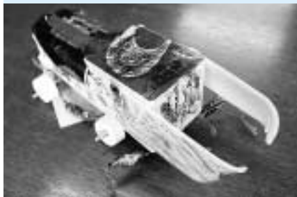
「くわがたのくるま」