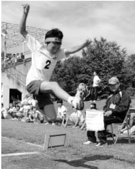
種目は男女別、学年別の38競技。選手たちは練習の成果をいかに発揮しました(走り幅跳び)

第1回八幡平市小学校陸上競技会は9月14日、松尾地区陸上競技場で行われました。昨年までは、旧西根町と旧松尾村が合同で「西根町松尾村小学校陸上競技大会」を開催。旧安代町は「安代町小学校陸上記録会」を開催していましたが、合併に伴い八幡平市として開催されました。