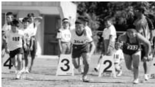
八幡平市となり最多の12校が参加した小学校陸上競技会。たくさんのライバルたちと競い合いました(100m)