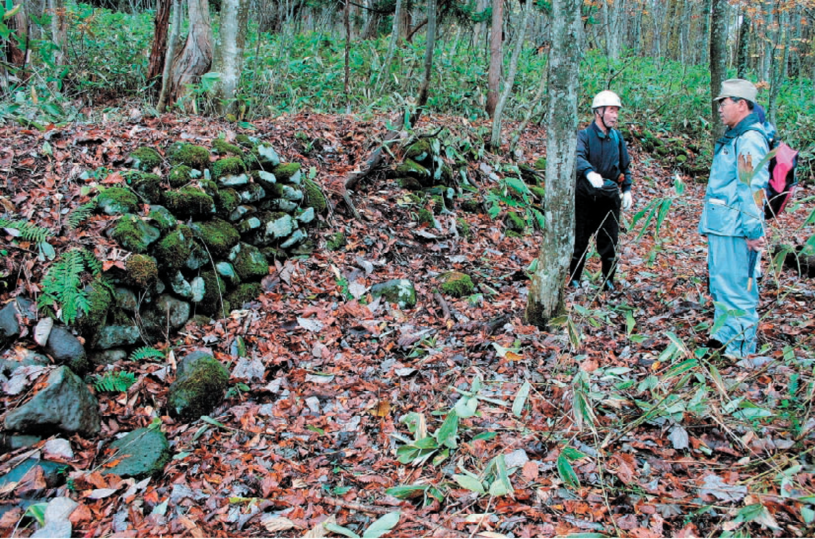
ここから先は男性しか通れなかったとされる結界御改場跡。巾23m奥行き4mにわたって土台石が残っています