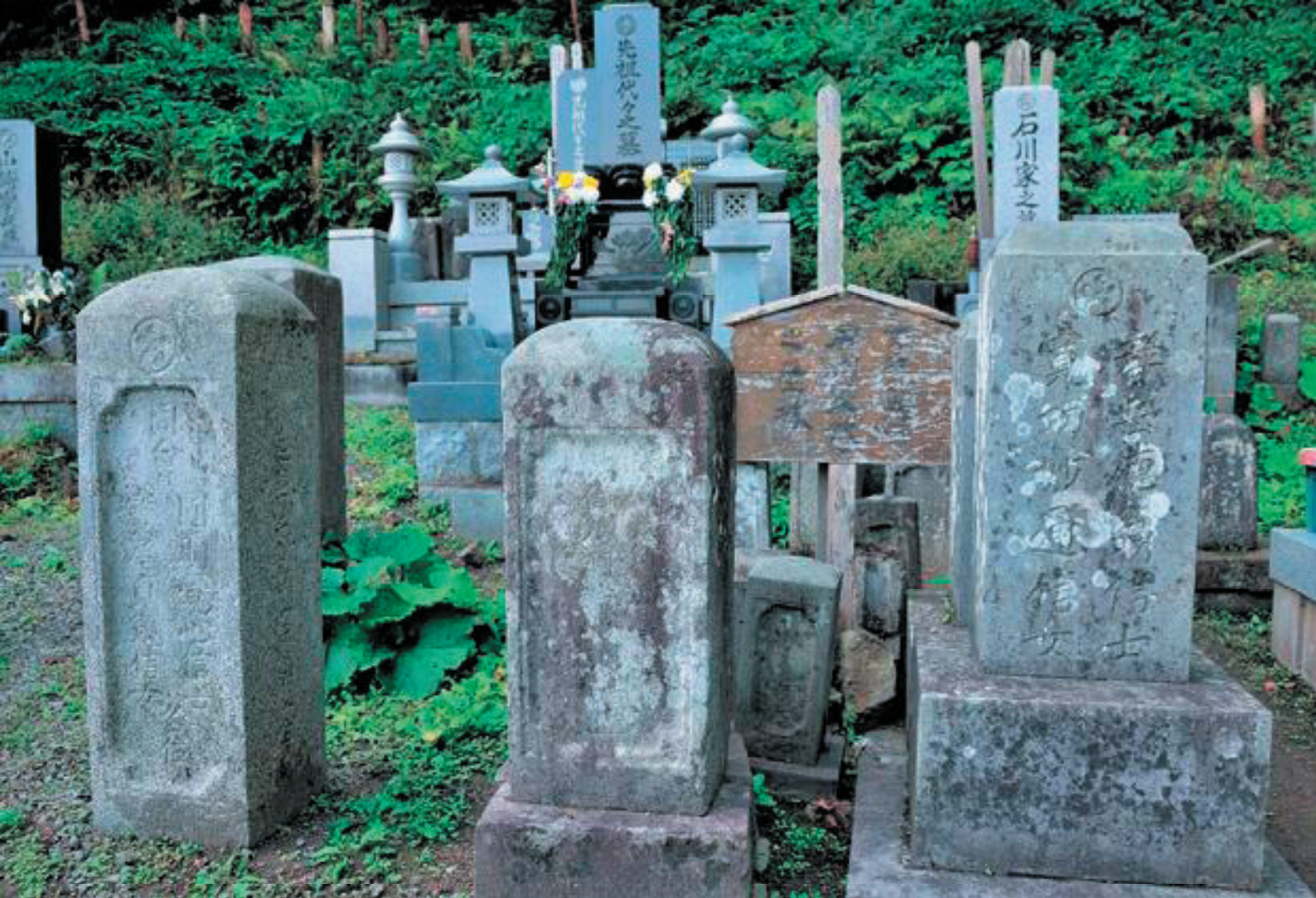
「啄木之先祖 石川家代々之瑩塔」と書かれた札（写真）が目印です