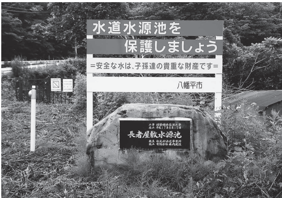
水の安定供給を図る施設の一つとして市が管理している長者屋敷水源池

市長 市民にさらに負担を求める環境にはなっていないので、料金引き上げはしない方向で精査する。