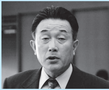
日本共産党 高橋 悦郎 議員