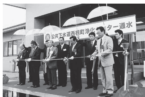
平成16年に完成した西根浄化センター

公共下水道西根浄化センターの増設に係る工事委託の協定を、日本下水道事業団と締結しようとするものです。