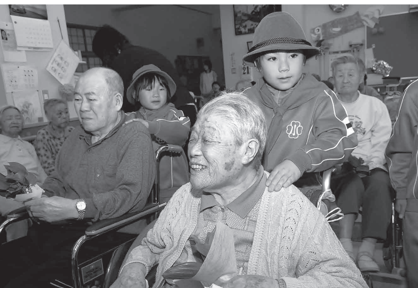
洪川小学校の児童たちが、特別養護老人ホームむらさき苑の入所者にスズランを贈りました

教育長 昨年度から市立図書館、松尾・安代公民館図書室のデータのネットワーク化を図り、子ども、一般市民の図書館利用と読書普及へのシステム化に努め、一層整備検討していきたい。