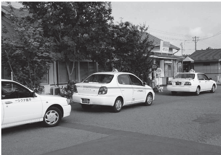
タクシー事業の規制緩和の見直しを求める請願は、全会一致で採択となりました

6月定例会では、継続審査としていた1件を含む請願7件を審議の結果、1件を不採択、1件を趣旨採択、4件を採択、1件を継続審査としました。審議した請願・発議案は次のとおりです。