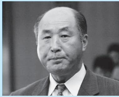
日本共産党 米田 さだ お 議員