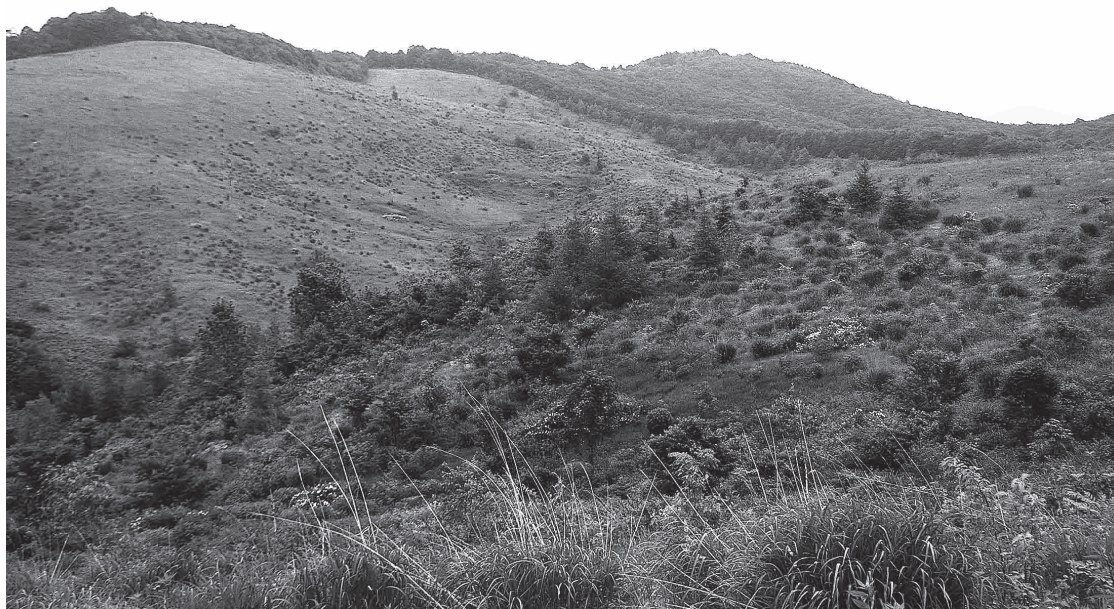
現在は休止状態の市宮丑山牧野(田山)

いについて伺う。 市長 市で管理している遊休農地の主な農地は、安代地域に2カ所の牧野がある