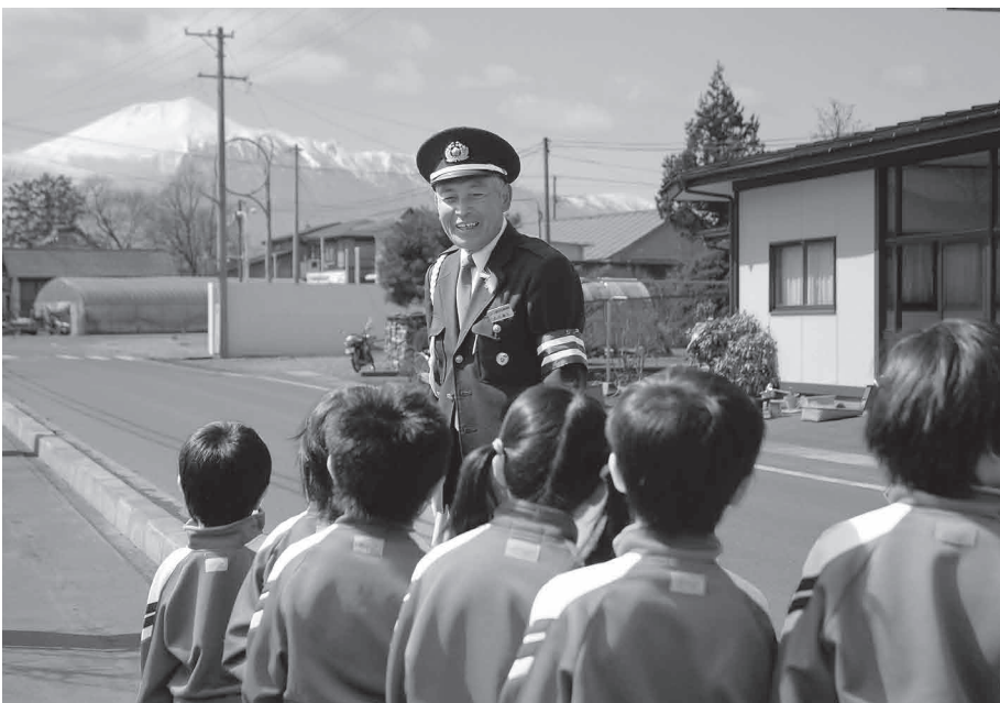
市内の各学校では、毎年春に交通安全教室を実施し、子どもの事故防止を図っています

市長 制度化は難しいが、市職員には徹底した地域行事への参加を指導・お願いしている。