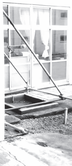
西根第一中学校（写真）などの耐震化を進めていきます