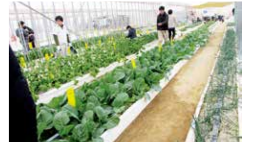
わーくはびねす農園あいち豊明ファーム

愛知県豊明市で、障がい者就労支援を学びました。「わーくはびねす」では、障がい者雇用のコンサルティングと、法定雇用率を満たせない企業向け貸し農園の運営で月給10万円を実現した。223社が参画し、1,274名の障がい者雇用を創出する取り組みを研修しました。