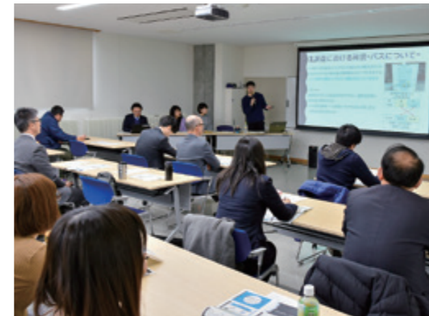
自然散策バスと路線バスを組み合わせた周遊プランを提案

学生が①八幡平山頂レストハウスや自然散策バスの利用者への満足度②外国人観光客への八幡平の認知度と魅力③コミュニティバスの利用状況一の3つのテーマを調査し、分析結果や改善案を発表。参加者と課題改善に向け、意見を交わしました。