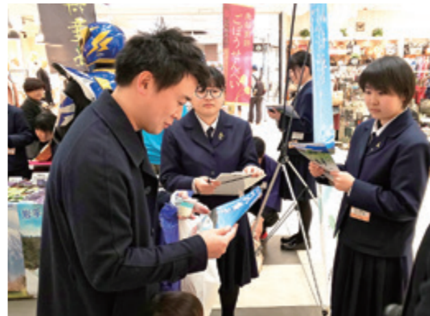
キセキドラゴを手渡し第一印象に耳を傾ける生徒

生徒らは、地元の観光資源やPR方法について学ぶとともに、市内の飲食店の協力を得て試作や研究を重ねてきており、今回の調査結果を今後の商品開発に生かそうと、意欲的に試食を呼び掛けていました。