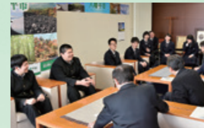
国際交流事業でシンガポールに派遣される平舘高の1、2年生7人が市長を表敬訪問(3月19日、市役所)