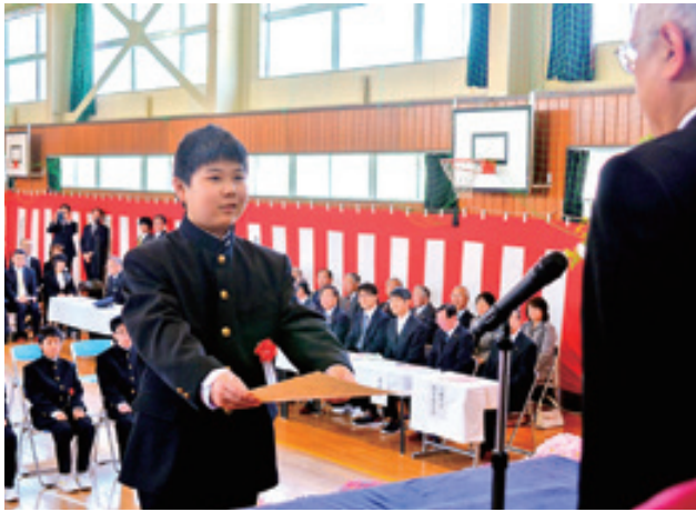
平館小の卒業生一人一人に卒業証書が手渡されました