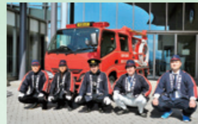
市消防団第36分団に小型動力ポンプ積載車が引き渡されました(3月18日、市役所前)