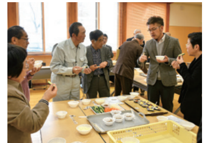
貴まるで作った豆腐やみそなどの試食を交えて意見交換

産学官が連携して、大豆「貴まる」の普及および商品化に取り組んできた活動を発展させ、市の今後の農業の可能性を探り、高めることが目的。参加した市内外の農家や関係機関の職員ら約50人は、米やソバなどの新品種や、超省力を実現する水稻の初冬直播き栽培などの新技術に興味を深めました。