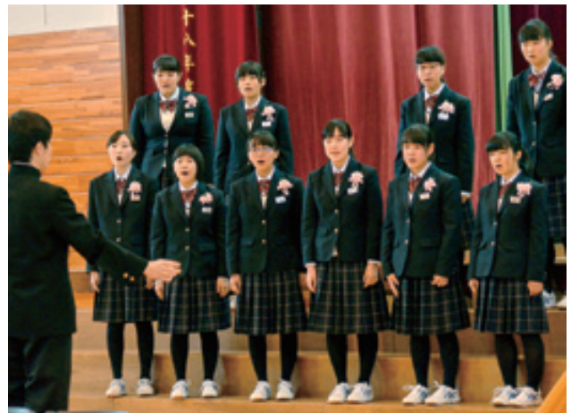
感謝の心を込めて「遥か」を合唱する安代中卒業生

ことしの市内小中学校の卒業生は、小学校が10校176人、中学校は4校198人の計374人でした。