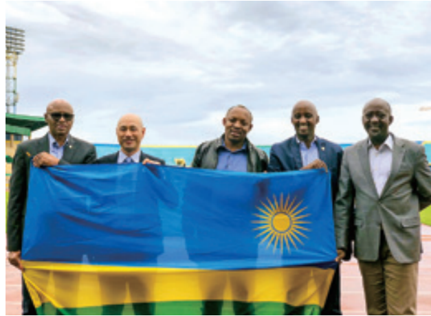
組織委員会のあるアマホロススタジアムにて記念撮影