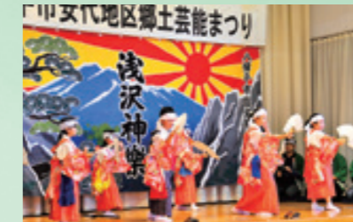
6年ぶりに開かれた安代地区郷土芸能まつり。浅沢神楽を披露(3月10日、荒屋コミセン)