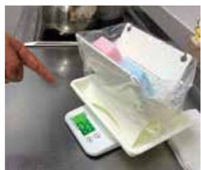
水を切る前に生ごみの重量を計測します