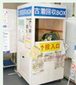
市役所に設置された古着回収ボックス