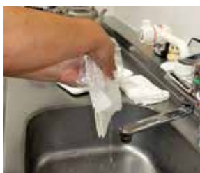
両手で挟んで水を切り、再度計測します