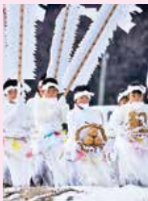
平笠裸参りの衣装や小物作りに協力

他には、地元の花壇の手入れ、平笠裸参りや宮田神社例大祭へ参加するなど、地域との関わりを積極的に持つようになっています。また、田頭コミュニティセンター主催の生涯学習教室「曙大学」へ参加し、他の地域の人たちとの交流も大事にしています。