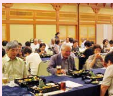
曙大学「修学旅行」で交流