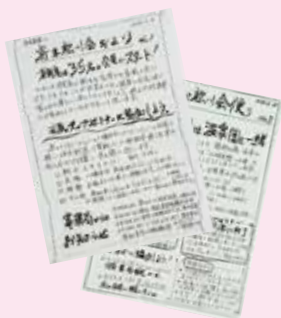
手作りで伝える『寄木松川会だより』

毎月広報を発行し会員へ配布。活動への参加呼び掛けや欠席した人とも情報を共有しています。