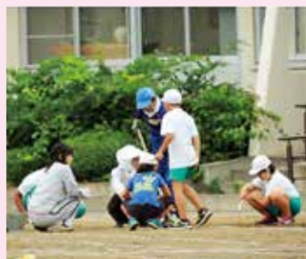
子どもたちと一緒に校庭の草取りをしながら会話を楽んでいます(寄木小)

毎月広報を発行し会員へ配布。活動への参加呼び掛けや欠席した人とも情報を共有しています。