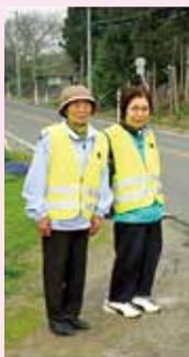
児童らを優しく見守ります

市の老人クラブ連合会が開催する各種大会のほか、グラウンドゴルフ大会や温泉を楽しむ会など、定期的にみんなで集まって活動する機会を設けています。また、地域ぐるみで子どもたちを育むことを目指す教育振興運動にも積極的に関わりを持ち、地元の小学校の児童見守り活動をはじめ、子どもたちの田植え体験や障子張りなどの活動を通して交流を深めています。