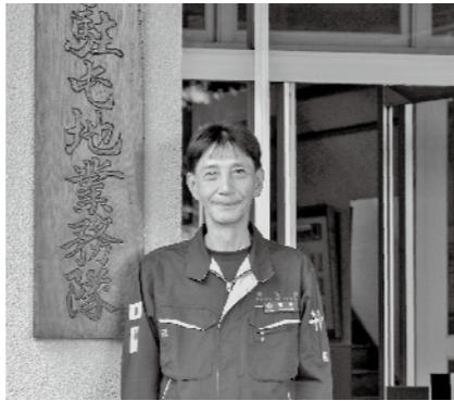
瑞宝双光章(防衛功労) 元2等陸尉