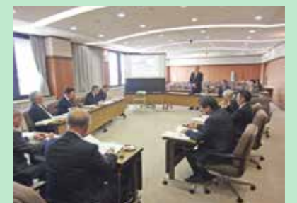
石川県加賀市(10月17日)

加賀市議会では、議会基本条例に基づき、さまざまな取り組みを実施しています。開かれた議会、市民が参加する議会を目指し、子ども議会、高校生議会、高校生との意見交換会、女性議会などを開催しています。