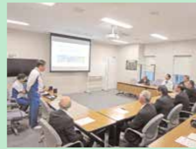
アステラスファーマテック(株)西根工場

当常任委員会の所管している事業で、可能な限り時間を取り企業訪問したいと思っています。今回は、医療機関向けの製薬を製造しているアステラスファーマテック(株)西根工場と、味付ゆでたまご・温泉たまごを製造している(株)岩手エッグデリカを視察しました。