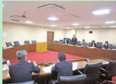
兵庫県丹波市(10月22日)

亀山市議会では、議会映像の配信にあたり、特にもケーブルテレビを用いた「こんにちは！市議会です」の議会報告番組を制作し、市民へダイジェスト放映しています。