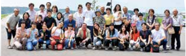
お別れセレモニー