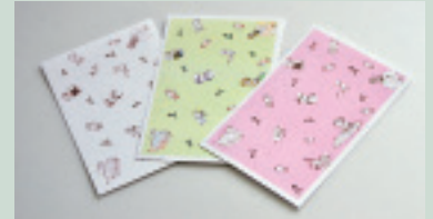
ポストカードは白、薄いグリーン、ピンクの3種類です

企画展「おかえり松尾釜石環状列石(ストーンサークル)」で紹介した土偶をキャラクター化したもので、ほのぼのとした絵柄が好評のポストカードです。1枚100円で販売しています。