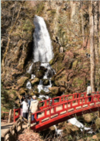
不動の滝まつりに訪れる人たち