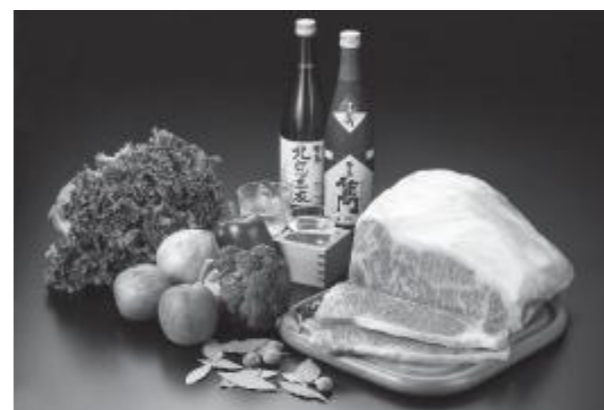
ふるさと納税返礼品の一例

市は、本市にふるさと納税をした市外在住の寄付者へのお礼として、地場産品やサービスを提供していただける生産者や事業者を募集します。 つきましては、説明会を開催しますので、ご参加ください。 説明会 ▼日時 3月27日(火)の午後1時半から3時まで ▼場所 市役所多目的ホール棟 募集する返礼品の一例 ▼商品 野菜/山菜/果物/米/加工品/