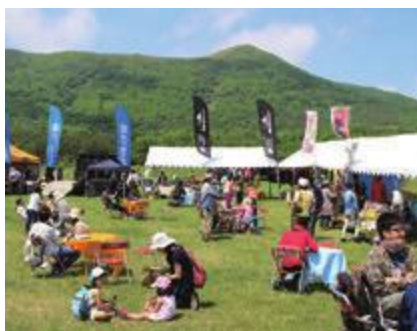
選手や家族が「マルシェ」でくつろぎます