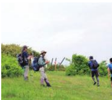
選手を応援する登山者たち

理解とご協力をお願いします。 また、ランナーへの皆さんの応援もよろしくお願いします。 ■日時 6月4日(日)午前8時スタート ■場所 七時雨山周辺(左上図のとおり) ■問い合わせ先 七時雨マウンテントレイルフェス実行委員会事務局(☎080・5560・7070)