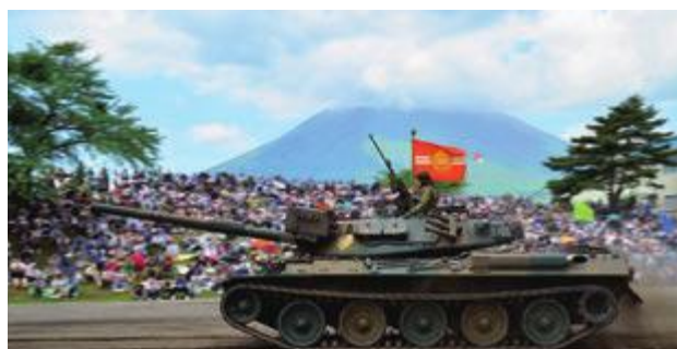
戦車の体験搭乗などイベントが盛りだくさん