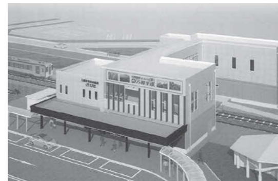
新大更駅の完成イメージ