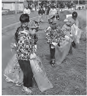
競技場周辺のごみ拾いを実施(26年9月27日、田山地区)

■応募要件 応募時点で中学生以上の個人またはグループ・団体 ※応募時点で18歳未満の場合、保護者の同意(記名押印)が必要 ■募集人数 ▶冬季大会=100人程度 ▶本大会=700人程度