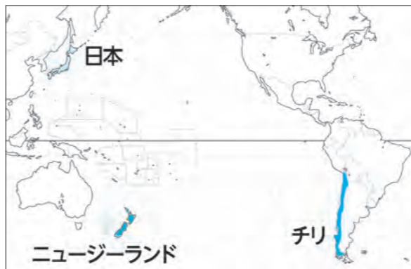
参考 日本とチリ、ニュージーランドの位置関係