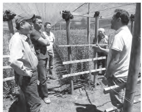
現地リンドウ生産者のほ場を訪れ 意見交換(1月14日、チリ)

1月13日(現地時間)には、チリ政府機関と会談し、チリのリンドウ生産者に対する補助事業を要望。チリでの「安代りんどう」生産・輸出体制確立に向け、今後の方針について話し合いが行われました。