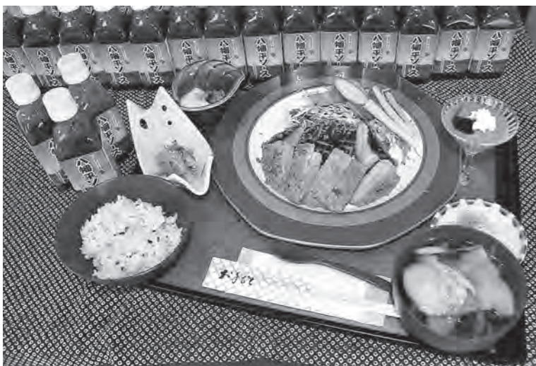
国体おもてなしメニュー「大地の恵み御膳」

同御膳は、盛岡広域振興局の「国体おもてなしメニュー開発支援事業」の補助金を活用し、八幡平市産業振興株式会社が企画開発。