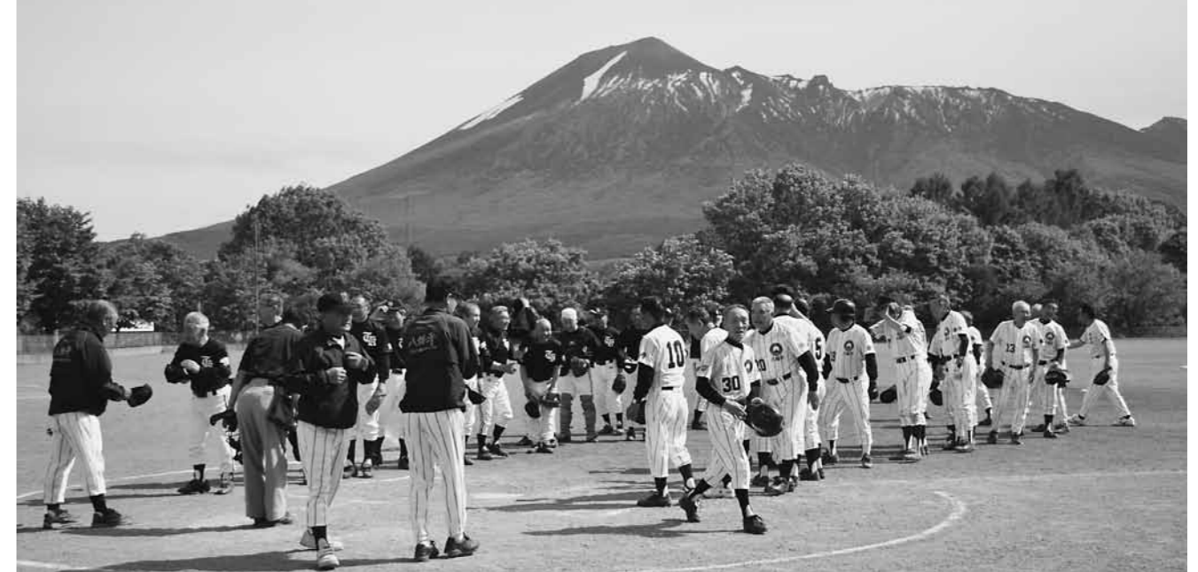
がんばろう岩手基金活用支援事業補助金を活用した釜石市古希野球クラブ交流・リフレッシュ事業(平成25年6月1日、なかやまグラウンド)

• 資本的収入・支出…企業の将来の経営活動に備えて行う建設改良や企業債償還金などの支出と、その財源となる収入