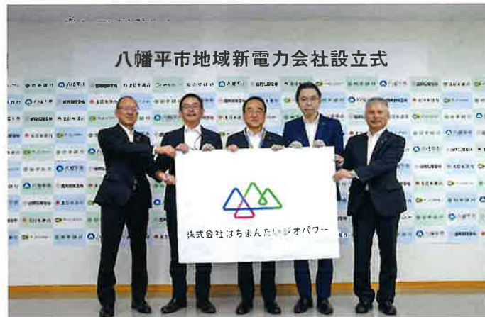
（写真）左より、北日本銀行常務取締 役、アーバンエナジー社長、八幡平市市 長、岩手銀行取締役、盛岡信用金庫 副理事長

市制20周年を迎える八幡平市 への多くの方の来訪を心待ちに しますとともに、会員皆さまの ご健勝とご多幸を心からご祈念 申し上げます、あいさつとい たします。