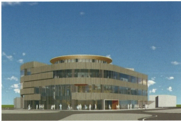
交流複合施設「8テラス」イメージ図

さて、本市におきましては、大更駅前に交流複合施設「通称…8テラス（はちてらす）」が、本年度オープンする予定であり、移住定住センターやチャレンジショップ、子育て支援施設、図書館などの機能を有する複合施設として、にぎわい創出の拠点となるよう努めていくところでございます。