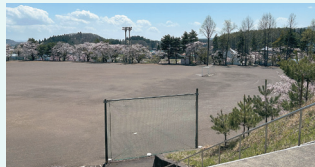
新校舎の建設場所となる西根中敷地

この結果、評価が最も高かった「現西根中学校」を最優先候補地とすることを、統合検討委員会などで協議し、3月23日の市総合教育会議で了承され、同案を建設場所に決定しました。