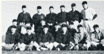
松尾鉱山野球部のメンバー(32年5月)

戦後、21年(1946)に軟式の野球部として部が再起を遂げると、31年(1956)には硬式野球に転向。社会人野球協会に加入し、念願の硬式野球復活を果たしました。