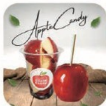
yummy yummy りんごあめ.たい焼き