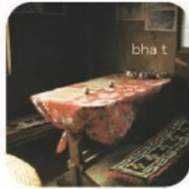
bhat チャイ.ネパール蒸し餃子