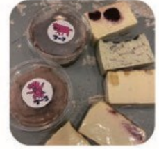
ブーコのチーズケーキ チーズケーキ