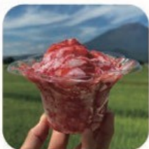
彩花園 BERRY HAPPY 削りいちごほか