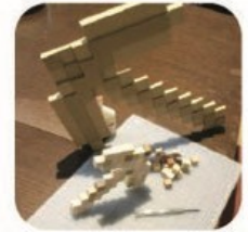
マイクラクラ 木工体験