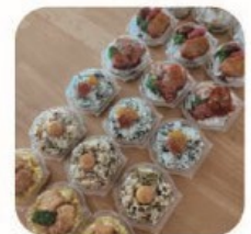
創作おむすび専門店 むすぶ 創作おむすびほか