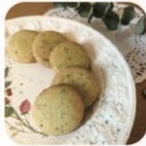
岩手県立平舘高等学校 紫薫枕.バジルクッキーほか