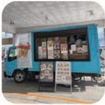
cuucafe クレープ.コーヒーほか