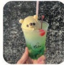
カフェ&スナック Fika しろくまフロートほか