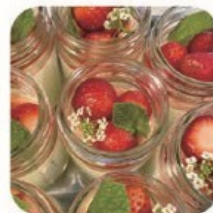
a Macchietta 焼き菓子ほか