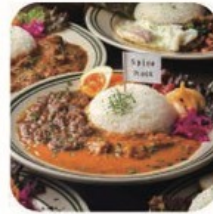
Spice Rack スパイスカレーほか