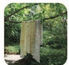
けるるん堂 草や木の小物