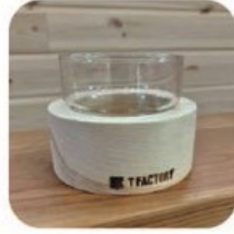
T FACTORY 木工作品