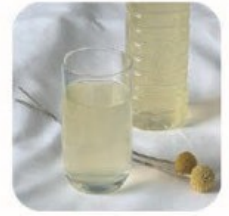
八幡平市商工会女性部 レモネードスタンドほか