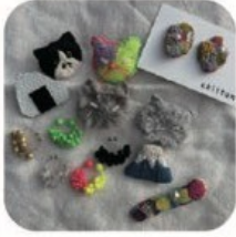
ブローチ屋 chittan 刺繍のアクセサリ