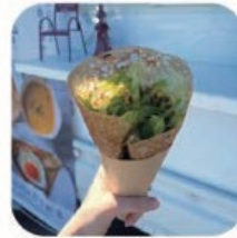
atagoya ガレット.スープほか