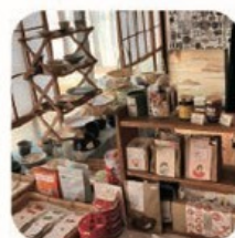
千-sen- 竹かご.衣料ほか