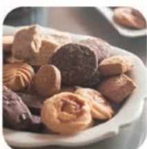
かおり菓子店 焼き菓子