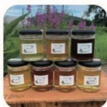
農園木星 八幡平のハチミツ