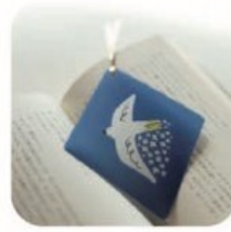
iRo i 紙製品