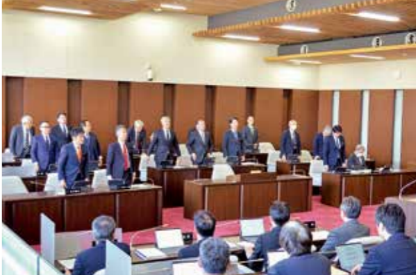
3月定例会議案採決(議案第30号)