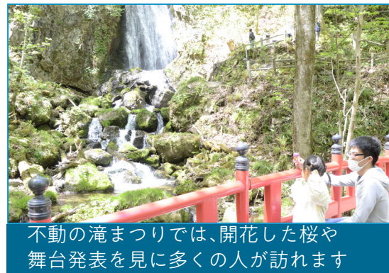
不動の滝まつりでは、開花した桜や 舞台発表を見に多くの人々が訪れます