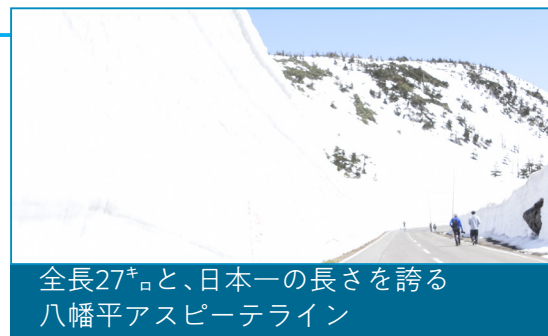
全長27*と、日本一の長さを誇る 八幡平アスピーテライン