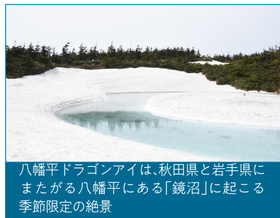
八幡平ドラゴンアイは、秋田県と岩手県に またがる八幡平にある「鏡沼」に起こる 季節限定の絶景