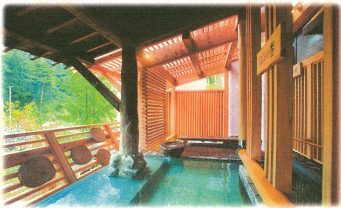
〔露天風呂からの景色〕

ここでは、足が不自由な人でも安心して入れます！中にはバリアフリールームがあり、足が悪くても動きやすいので安心して利用することができます。